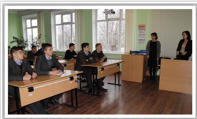
2 марта для формирования понятия «гражданская оборона», навыков безопасного поведения в чрезвычайных жизненных ситуациях, ознаком-

ления воспитанников с правилами пожарной безопасности, воспитания чувства ответственности за свою жизнь и жизнь окружающих учителя провели единый классный час «1 марта – День всемирной Гражданской обороны».